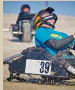
Kitebuggy WM 2018