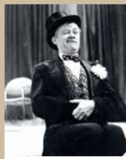
Körners Literaritäten Kabinett