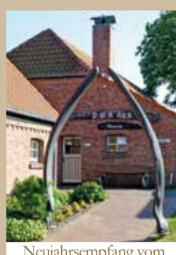
Neujahrsempfang vom Heimatverein